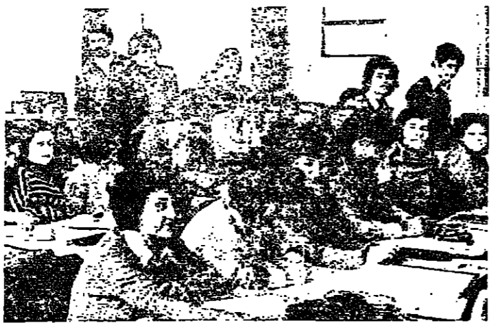
داخل احد الصفوف